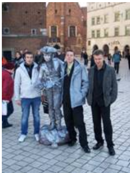
22 październik wycieczka do teatru Groteska