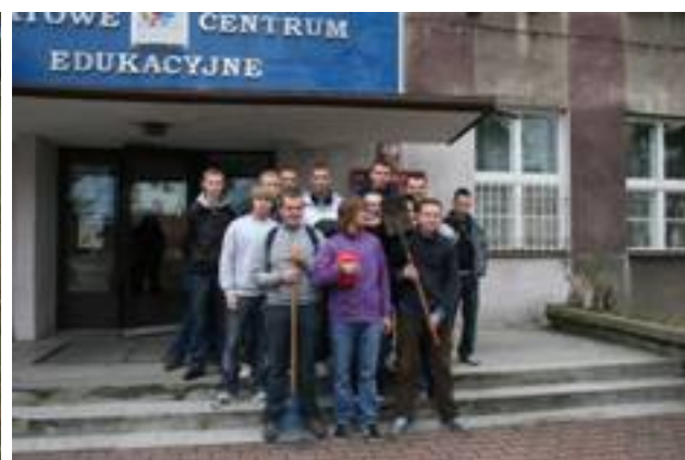
A drzewo posadziliśmy przed szkołą...