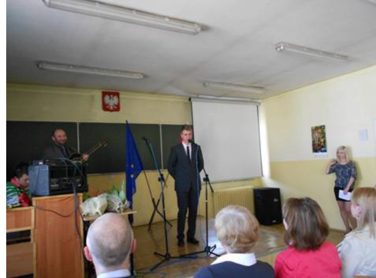
26 kwietnia - pożegnanie klas maturalnych