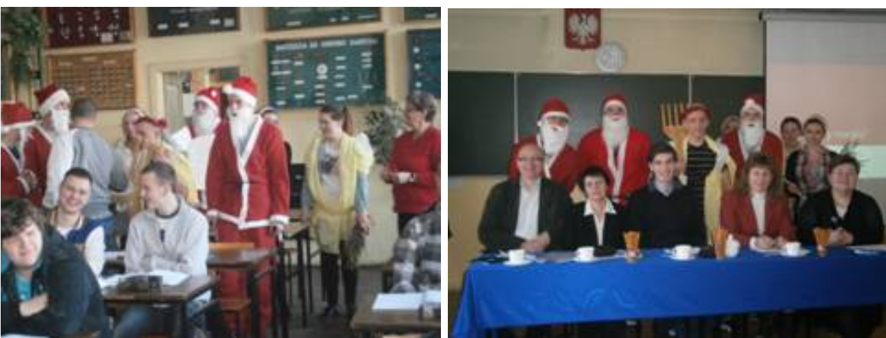
6 grudnia – Mikołaj w szkole