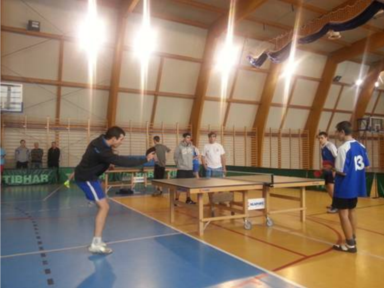
9 stycznia - zawody tenisa stołowego w ZSTU w Trzebini

Uczniowie PCE ponownie dzielą się tym, co najcenniejsze – oddają krew. 13. lutego młodzież naszej szkoły uczestniczyła w akcji „Młoda Krew Rатуje Życie”. Chętnych do udziału w akcji było wielu. Część uczniów nie oddała krwi ze względów zdrowotnych. Uczniowie z technikum i zsz oddali łącznie 1800 ml krwi .