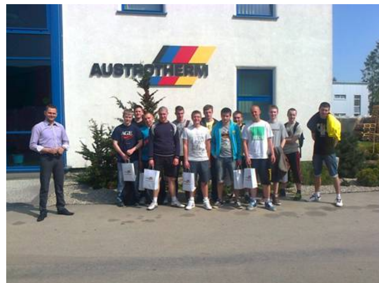
26 kwietnia - Wizyta w AUSTROTHERM S.A. w Oświęcimiu

Celem wycieczki-wizyty zawodoznawczej było zapoznanie uczniów z funkcjonowaniem i specyfiką pracy produkcyjnego zakładu przemysłowego o specjalności budowlanej. Wizyta obejmowała zwiedzanie nowoczesnej linii produkcyjnej styropianu w zakładzie AUSTROTHERM S.A. w Oświęcimiu oraz uczestnictwo w prelekcji na temat rozwiązań oraz zastosowania konkretnych (wybranych) firmowych wyrobów.